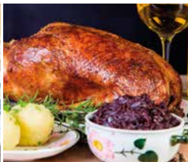
Für zuhause: Gans to go