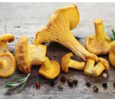
Für Pilzfreunde: Pfifferlingzeit