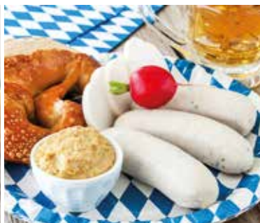
O'zapft is: Oktoberfestwochen