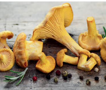
Für Pilzfreunde: Pfifferlingzeit