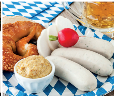
O' zapft is: Oktoberfestwochen