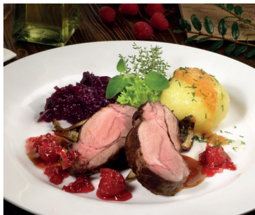
Weidmannsheil: Wild- u. Waldwoche