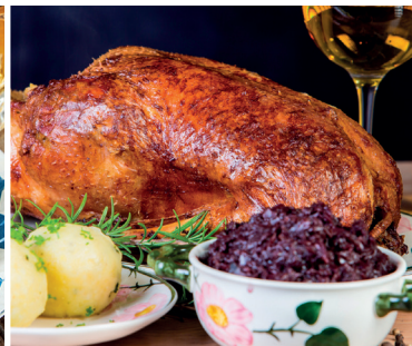
Für zuhause: Gans to go